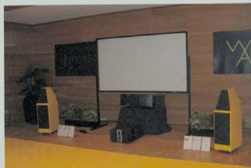
Wilson Audio Watt/Puppy 7.

eter. Em exposição estática encontrava-se a nova linha da Martin Logan , composta pelos modelos Mosaic , Fresco (satélites e central) e os subwoofers Grotto e Descent , para além das Clarity , referidas anteriormente.