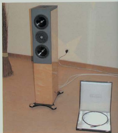
As NEAT MF7 com enblagem Black Rodium.

Na sala da Audio Eclipse encontrei outras conhecidas minhas, que fizeram as minhas delícias aquando do teste, as Neat MF7 , outro modelo acima dos 10.000€. Para