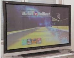
O plasma TH-50PV500 tem uma qualidade de imagem espectacular.