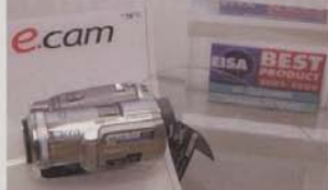
A Panasonic apresentou uma mão-cheia de novidades.