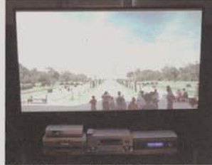
O Barco Cineversum 70 projectou imagem de televisão de alta definição.