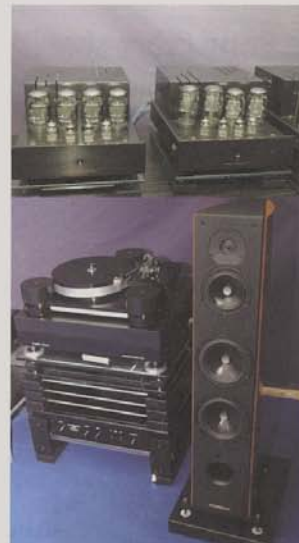
Prima Luna e Sonus Faber para um som com alma.

A Delmax apostou num sistema estéreo, composto pelos novos Prima Luna Prologue Four e Five , prévio e monoblocos que alimentaram umas Sonus Faber Grand Piano Domus . Na fonte esteve o Audio Research CD3 e o