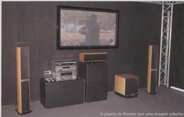
O plasma da Pioneer tem uma imagem soberba.