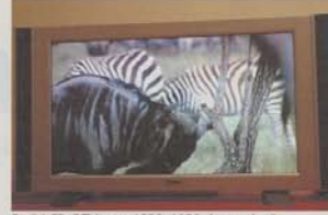
Ecrã LCD QTV com 1920x1080 de resolução.

da série Prestige, que este ano estiveram em grande destaque no Audioshow, Yorkminster nos canais frontais e Sandringham nos restantes, coadjuvadas por subwoofers REL Storm III e Strata V .