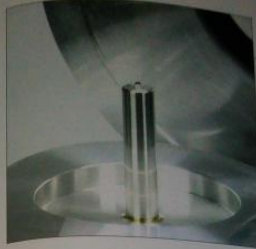
Das Uweker-Gehäuse ist ein Meisterwerk der Präzision. Die Teile sind aus einem Stück gefertigt und werden in Portugal gefertigt.

Die Grundkonstruktion ist einfach. Zwei voneinander entgegengesetzte MDF-Platten bilden die Zarge. Die Motor steht in einer kreisförmigen Ausparung. Unter das eigentliche Laufwerk kann eine optische Basis aus einer MDF- und einer Glasplatte platziert werden, auf die die Grundkonstruktion gesetzt wird. Basis und Plattenspieler stehen auf selbstverstellbaren Füßen, die ihren Zweck erfüllen, jedoch bei näherer Betrachtung nicht so ganz dem hohen Standard des Geräts entsprechen - hier könnte optisch noch ein bisschen nachgehoben werden. Das Tonarmbein aus Acryl wird über Distanzstücke aus Aluminium auf der Zarge befestigt. Unser Modell ist mit einem der vorzüglichen Real-Konstruktion besteht, die sein einziges in Italien gefertigt werden - nicht nach der schlichten Wahl. Für die Abtastung ist ein Goldene Bobbi zuständig. Dieses Set gibt es so auch komplett als Uwe Prestige zu kaufen.